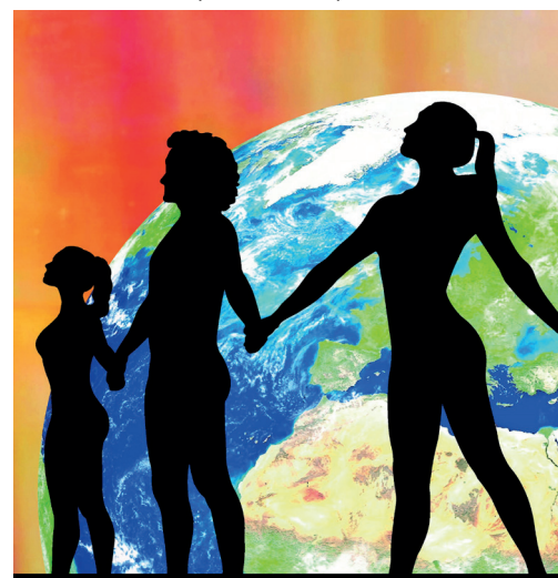
Moving Shadows Schattentheater 25.2.2024 | 18:00 Uhr | Großer Saal