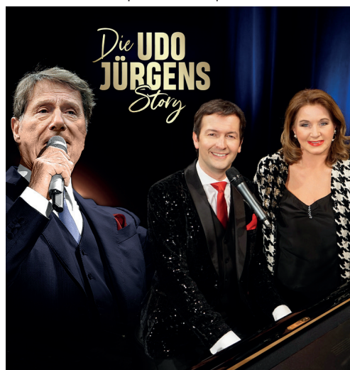
Die Udo Jürgens Story Sein Leben, seine Liebe, seine Musik! 17.2.2024 | 19:30 Uhr | Großer Saal