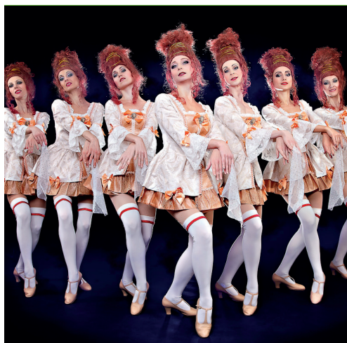
Showballett Energy Dancers in der großen Silvesterrevue