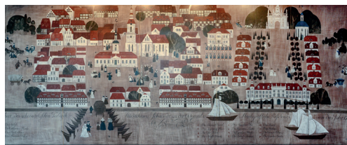
Eberhard Hückstädt, „Das alte Schwedt“, 1978, Kaseintempera auf Holz, 3,10 m x 7,75m © Udo Krause

Nolde wurde 1909 in Lahsdehnen (Kreis Tilsit, Ostpreußen) geboren. Seine Biographie steht wie die vieler seiner Zeitgenossen für die vielfältigen Verstrickungen und Brüche im 20. Jahrhundert. Über Stationen in Tilsit, Königsberg, Meißen und Dresden kam der Künstler 1963 nach Schwedt, wo er bis zu seinem Tod 1981 bleiben sollte. Hier übernahm er die Leitung zur künstlerischen Ausgestaltung des Petrolchemischen Kombines, war in mehreren Brigaden des PCK tätig und leitete den Zirkel des bildnerischen Volksschaffens, der bis heute als Malkreis unter seinem Namen firmiert. 3 Wie Hückstedt auch bediente sich Nolde der Kaseinmalerei – einer alten Technik der Temperabemalung, die anschließend mit