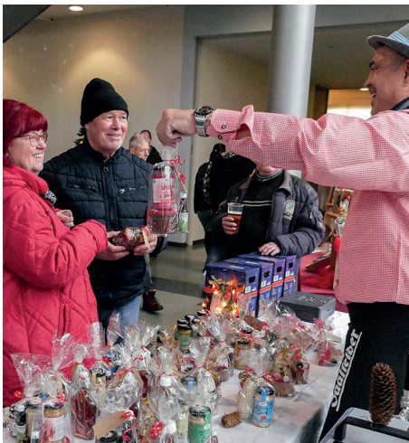
Martinsmarkt 2022

Termin: 25.11.2023 | 13:00 bis 17:00 Uhr | Foyer Großes Haus und Hauptfoyer