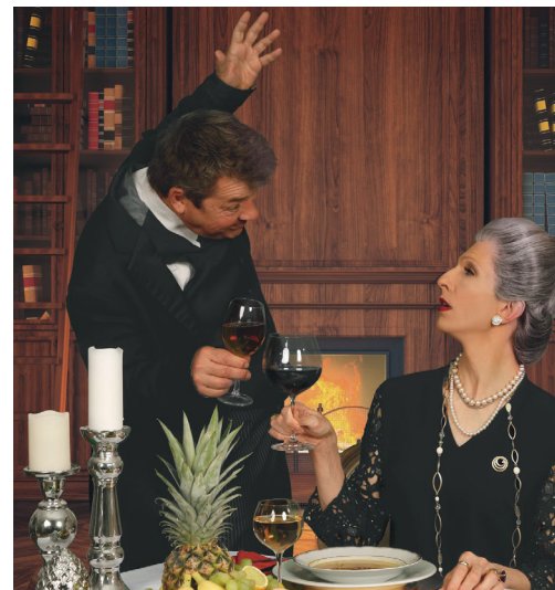
Dinner for One! Was geschah wirklich? 17.1.2024 | 15:00 Uhr | Kleiner Saal