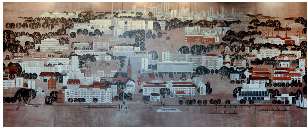
Franz Nolde, „Das neue Schwedt“, 1975-78, Kaseintempera auf Holz, 3,10 m x 7,75m © Udo Krause

Auf jeder Seite des Vestibüls vor dem Treppenaufgang zum Großen Saal befindet sich ein Tafelbild, das eine Ansicht des „alten“ der eines „neuen“ Schwedt gegenüberstellt. Das Wandbild von Franz Nolde mit dem Titel „Das neue Schwedt“ ist im nördlichen Vestibül zu sehen. Entstanden zwischen 1975 und 1978 dokumentiert das großflächige Gemälde den damaligen Zustand der neu entstandenen Industriestadt mit ihren Neubaublöcken und Hochhäusern an der ehemaligen Leninallee, am Hanns-Eisler-Weg und den Oberen Talsandterrassen, die im Hintergrund von den Industrieanlagen des Petrolchemischen Kombines überragt werden. 1 Wie bei seinem Gegenstück, dem Gemälde „Das alte Schwedt“ von Eberhard Hückstädt, wird das Panorama der Stadt von der Wasserseite aus gezeigt und in einer flächigen Perspektive aus der Vogelschau wiedergegeben. Nolde, bei der Entstehung bereits im fortgeschrittenen Alter, wurde bei der Fertigstellung des Gemäldes wohl von Eberhard Hückstädt unterstützt. 2