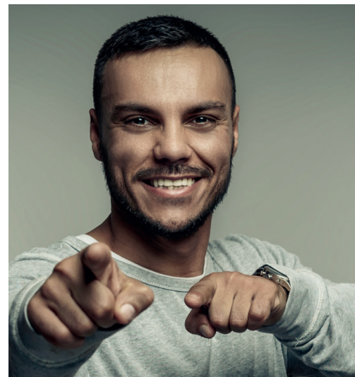
OSAN YARAN Gut, dass du fragst! 4.2.2024 | 19:00 Uhr | Großer Saal