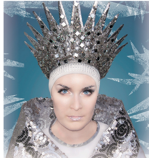
Die Schneekönigin – das Musical 7.1.2023 | 15:00 Uhr | Großer Saal