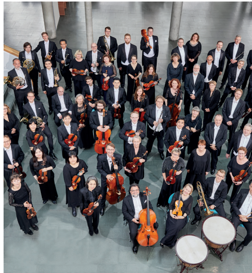
Neujahrskonzert Transatlantische NeujahrgrüÙe 4.1.2024 | 19:30 Uhr | Großer Saal